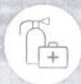
Огнетушитель и аптечка