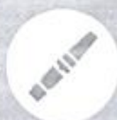
Штатные ремни безопасности