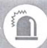
Маячок желтого цвета