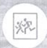
Опознавательные знаки «Перевозка детей»